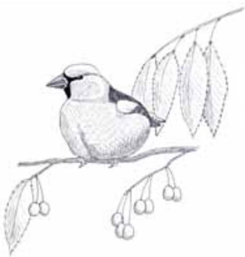
Stenknäck